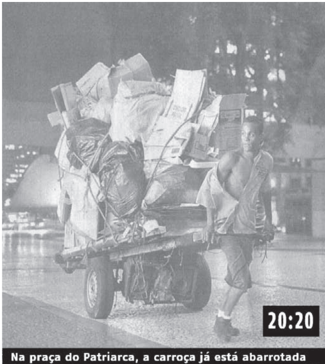
Na praça do Patriarca, a carroça já está abarrotada