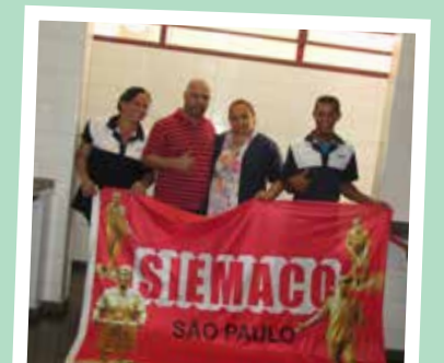
Empresa: Whiteness Setor: CEU Curuçã