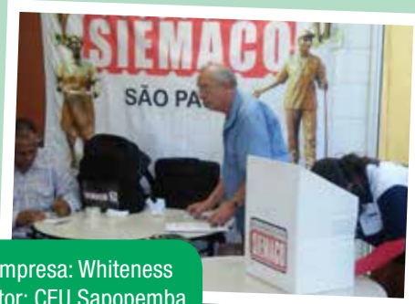
Empresa: Whiteness Setor: CEU Sapopemba