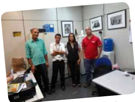
Star Clean – Vivo Berrini