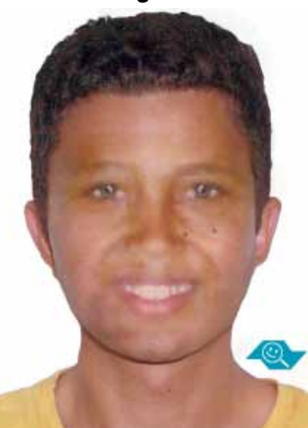
Progressão de idade 15 anos