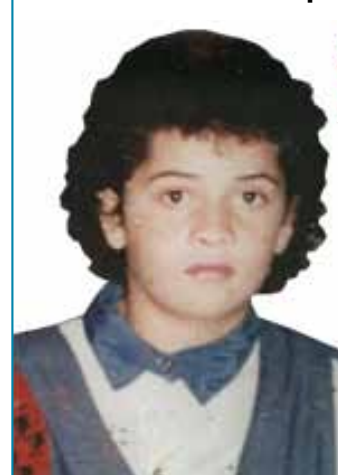
13 anos de idade, época do desaparecimento