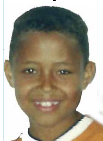
10 anos de idade, época do desaparecimento