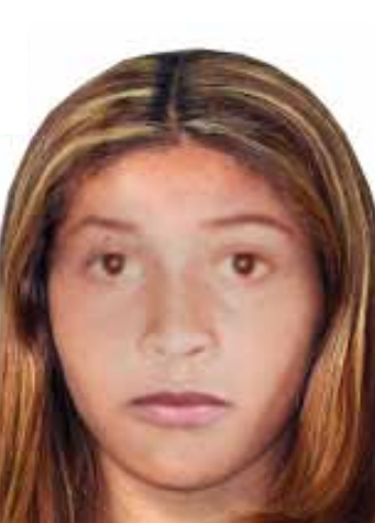
Progressão de idade 30 anos