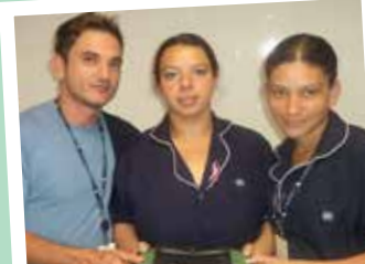
Empresa: ISS Servisystem Setor: Centro Empresarial Berrini