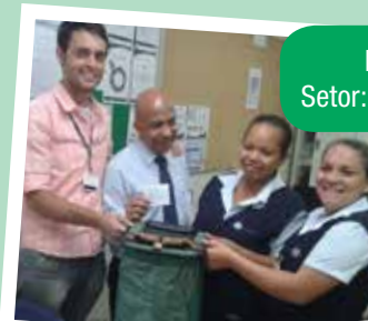
Empresa: ISS Servisystem Setor: Hospital Edmundo Vasconcelos