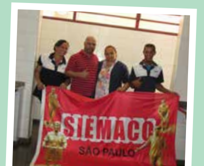
Empresa: Whiteness Setor: CEU Curuçã