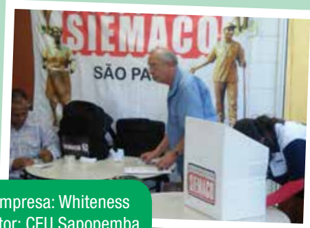
Empresa: Whiteness Setor: CEU Sapopemba